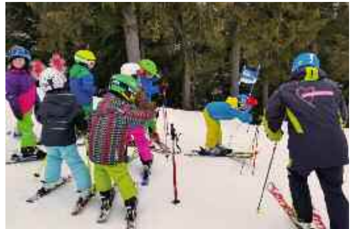
Kindertraining auf der Schipiste

Ohne die großartige Zusammenarbeit und Unterstützung unseres Dachverbandes, des ASVÖ Steiermark, und des Teams vom Bewegungs-