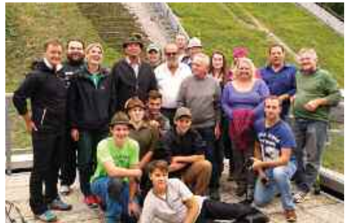
Die Mitterndorfer Musikanten besichtigten die Anlagen am Kulm

tete und uns eine tolle Führung bot. Über die Kulmstufen stiegen wir rauf bis zum Turm und durften diesen von unten bis oben besichtigen. Im Anschluss ging unsere Wanderung weiter zum Gasthof Jägerstüberl der Fam. Maissl/Peer, wo wir bei einem guten Essen und Getränken einen sehr schönen und informativen, aber vor allem kameradschaftlich sehr wertvollen Tag ausklingen ließen.