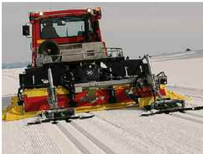
Der neue Pistenbully 100

dert sich, es hat sich auch bei den Salzkammergutloipen etwas getan. Die Vorbereitungsarbeiten für die kommende Langlaufsaaison sind abgeschlossen: