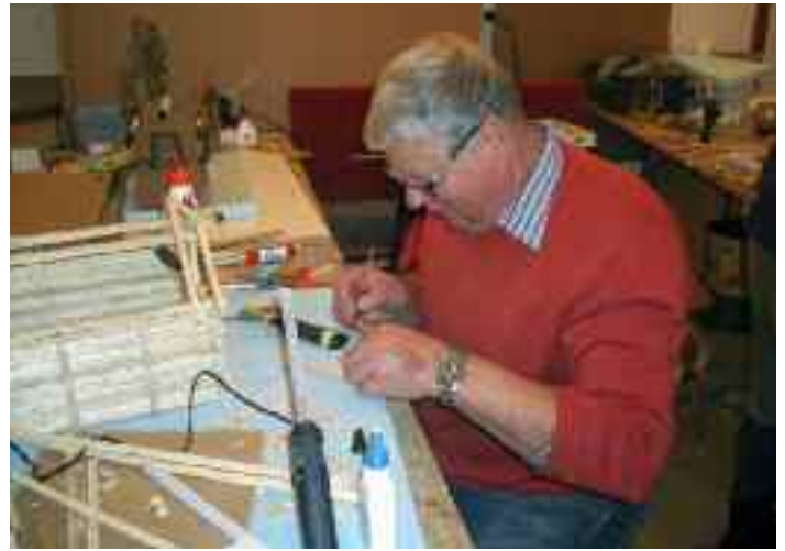
Beim Krippenbaukurs wird eifrig gebastelt

Die vollendeten Werke werden nach dem 5. Dezember