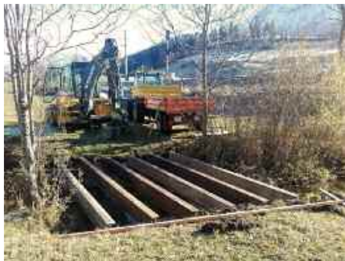
Die neue Loipenbrücke über den Krunglbach

rienmäßig ausgestattet mit beheizten Scheibenwischern, LED Beleuchtungspaket, 4 Laufachsen mit einem Fahrwerk 1.800 mm für Arbeitsbreiten 2,8 und 3,1 m. Weiters mit Kombi – Kette 820 mm (Satz) passend für Pistenbully 100 mit 4 Achsen; Schnellwechselsystem; 12-Wege- Räum-schild Arbeitsbreite 2,7 m; 2-fach Loipenspurgerät einzeln aushebbar; Schneefräse – Arbeitsbreite 2,5 m