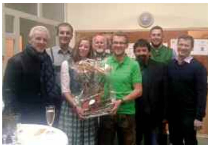
Auch der Gemeindevorstand überbrachte Glückwünsche zur Wiedereröffnung

Auch in der Kletterbox des Alpenverein Bad Mittern-