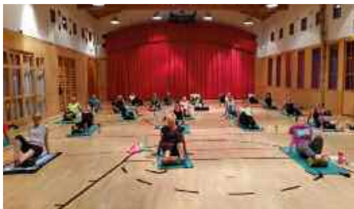
... und Frauenturnen mit dem WSV Tauplitz

50 Kinder aus der Großgemeinde Bad Mitterndorf und Umgebung zu mehr Bewegung zu motivieren.