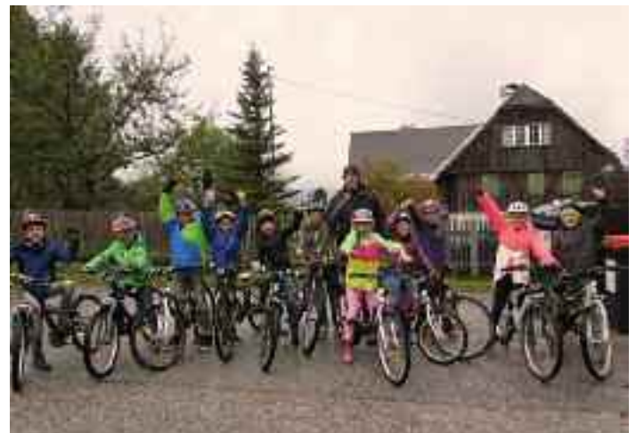
... und VS Knoppen