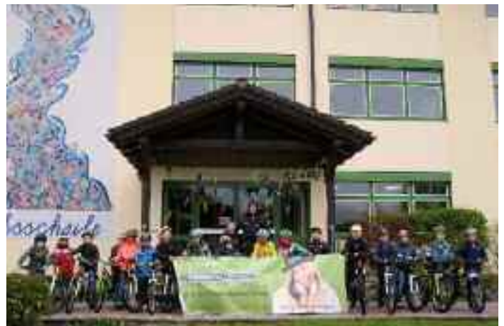
Die Radfahrer/innen der VS Bad Mitterndorf ...

Wir wünschen allen Kindern unfallfreie Fahrten!!!