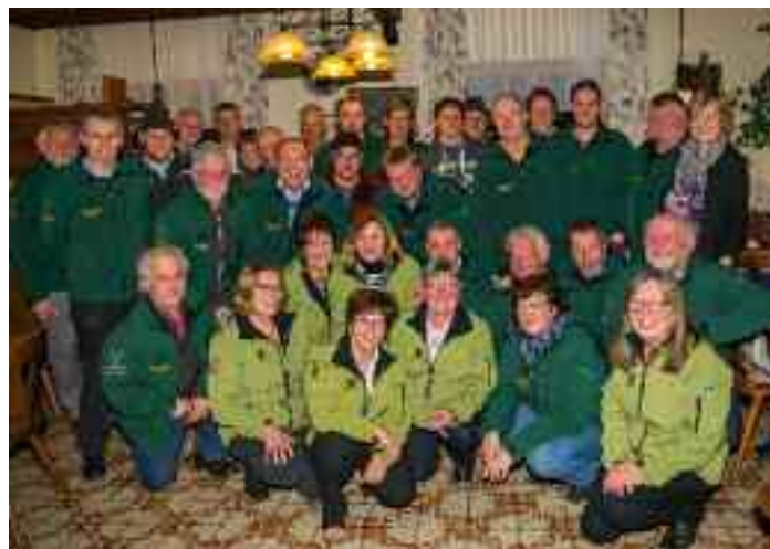
Die gutgelaunten Petrijünger und -innen im Gasthof Kalas

Aus den abgegebenen Fangstatistiken wurden drei Gewinner einer Tageskarte für 2017 gezogen.