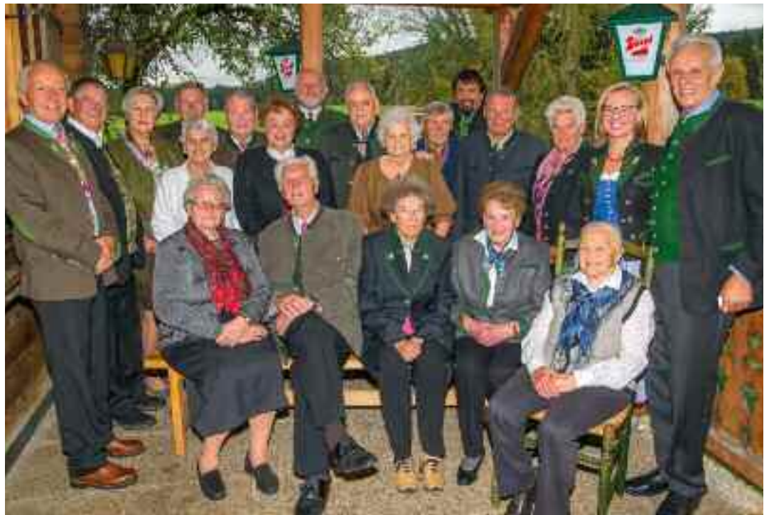
Die Jubilare mit Bürgermeister und Gemeindevorständen