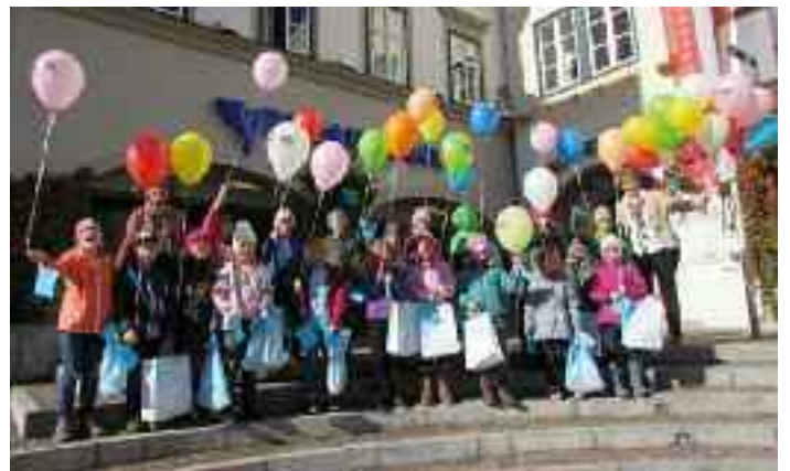
Die fleißigen Sparer der VS Knoppen vor der Volksbank Bad Aussee