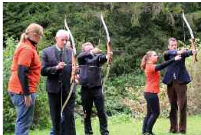
Erste Übungen durch die Ehrengäste

„Bogenschießen macht nicht nur Spaß. Es werden auch viele Bewegungsabläufe geschult, Rücken-, Schulter- und Brustmuskulatur werden gestärkt und die Freude an der Bewegung wird aktiviert. Bogenschießen fördert zudem die Ge-