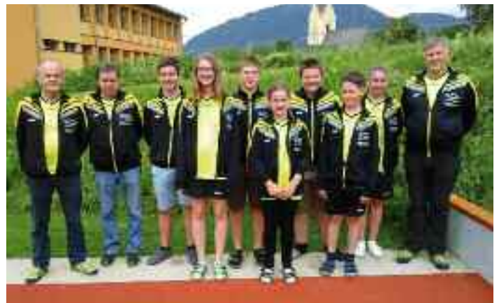
Jugendtraining an der NMS Bad Mitterndorf

Kinder zu sportlichen Aktivitäten begeistern, Teamfähigkeit fördern – das ist