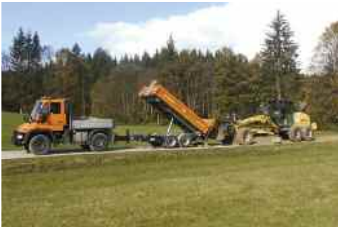
Wegschotterungen durch Gemeindebauhof

und -eigentümerinnen im Gemeindejagdgebiet: Nach Beschluss des Gemeinderates (Sitzung am 10.11.2016) kann nun bis 29.12.2016 die Auszahlung des Jagdpachteuro beantragt werden. Wenn Sie Ihren Jagdpachtanteil mittels Banküberweisung erhalten möchten, können Sie dies persönlich während der Amtsstunden oder mittels Mail an petra.wallner@bad-mitterndorf.gv.at beantragen. Die Überwei-