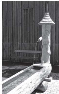
Dorfbrunnen in Krungl

Die Bauhofmitarbeiter tragen, wie in all den Jahren zuvor, wieder in vorbildlicher Weise zur Verschönerung unserer Heimat bei. So wurden u.a. der Geo-Trail zwischen Bad Mitterndorf und Obersdorf, neue Brücken am Zauchenbach, am Krunglbach zwischen Duckbauer und Heilbrunn sowie in Obersdorf errichtet. Besonders erwähnenswert ist noch der neue Dorfbrunnen in Krungl . Alle Arbeiten spiegeln die sehr guten handwerklichen Fähigkeiten der Bauhofmitarbeiter deutlich wider und erfreuen jeden Gast und Bewohner von Bad Mitterndorf.